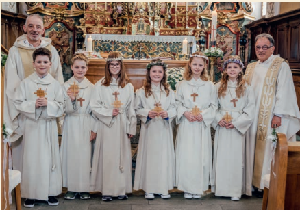
Emprema communiun 2023 a Sevgein

Illanz: 7. April um 10 Uhr Schluain, era pils affons da Sagogn: Ils 14 d'avrel allas 10.00 uras