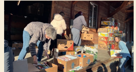
Sammlung im Jahr 2022