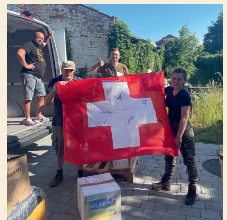
Entladung in der Ukraine