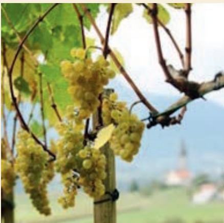
Weinberg in Sagogn

Ich bin der Weinstock, ihr seid die Reben Jeu sun la vit – vos essas las frastgas