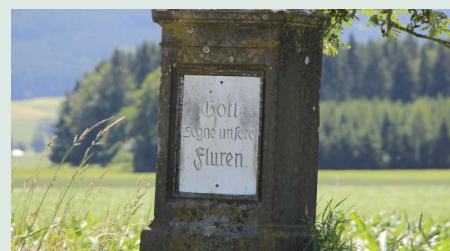
Gott segne unsere Fluren