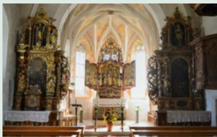
Bild: Innenansicht der Kirche s. Maria