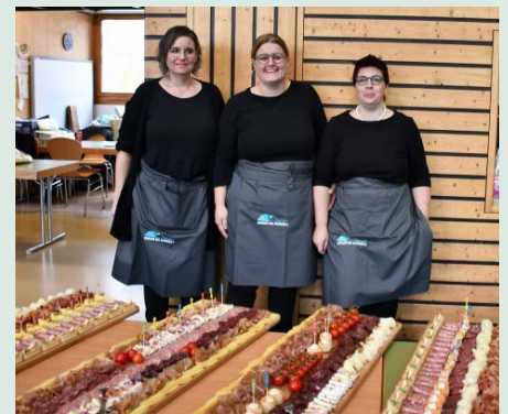
October 2024 a Sagogn