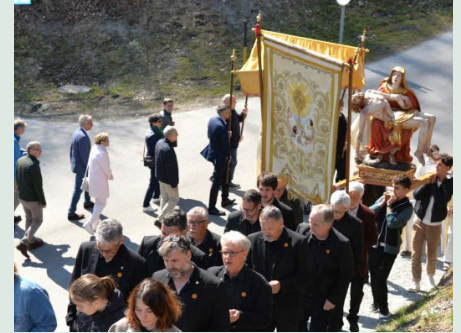
Avrel 2025 a Sevgein