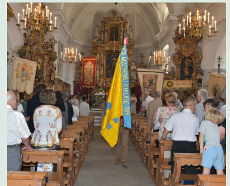
Zercladur 2022 a Schluain

Dapli fotos sin nossa pagina-web. Mehr Fotos auf unserer Webseite www.pfarrei-ilanz.ch