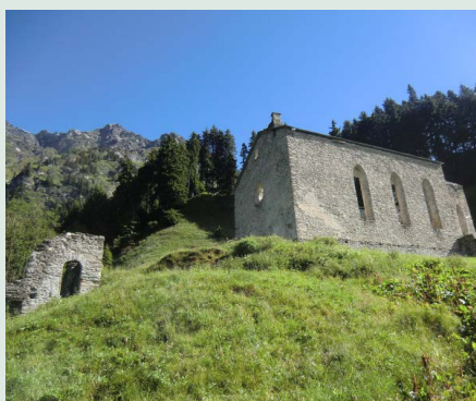
Reste der Gaudenz geweihten Kirche über seinem Grab und des Hospizes bei Casaccia