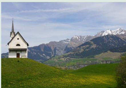
Caplutta s. Gudegn

Die Kirche hat eine interessante Geschichte. Verschiedene Maler hinterliessen im Verlauf der Jahrhunderte ihre Spuren. Eine fachkundige Person wird uns die Geschichte und die Bedeutung der Kirche erläutern. Auf dem Weg von Vignogn nach Degen besichtigen wir die Kapelle Sogn Gudegn.