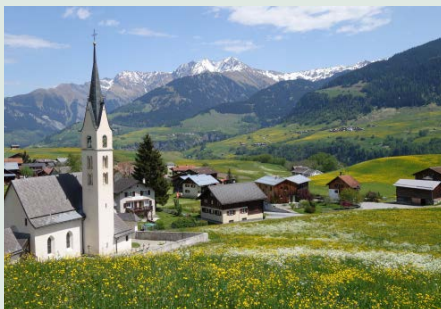
Degen cun baselgia s. Maria

Die Pfarreirat lädt alle zur diesjährigen Wallfahrt nach Degen (Kirche s. Maria) ein.