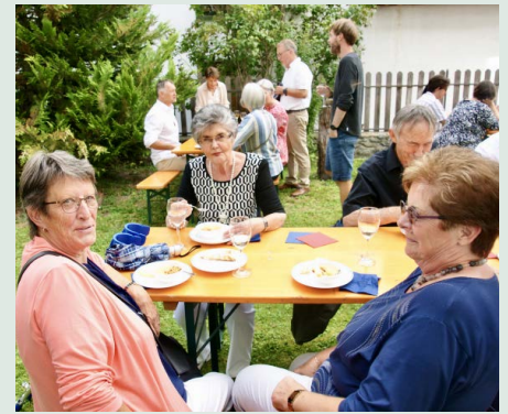
August 2023 in Ilanz