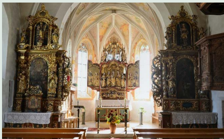
Innenansicht der Kirche s. Maria