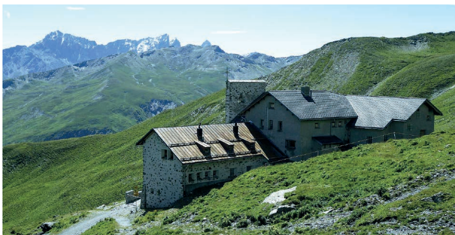
Ziteil – in liug da peleginadi nua che via, cuntrada ed oraziun vegnan ensemen.

Era el Grischun dat ei loghens che tucan cor ed olma. Mustér cun sia claustra e la baselgia da Nossadunna dalla Misericordia ei per mei in liug nua che cardientscha, historia e cuntrada vegnan ensemen a moda speciala. Ins senta leu enzatgei constant e quei dapi tschenteners. Independent da quei che capeta sin quei mund ed independent da quei ch'ei gest present en miu intern di per di. Buca lunsch naven sesanfla sur Trun Nossadunna dalla Glisch: in liug nua che biars carstgauns enqueran ed anflan confiart. Oz forsa meins