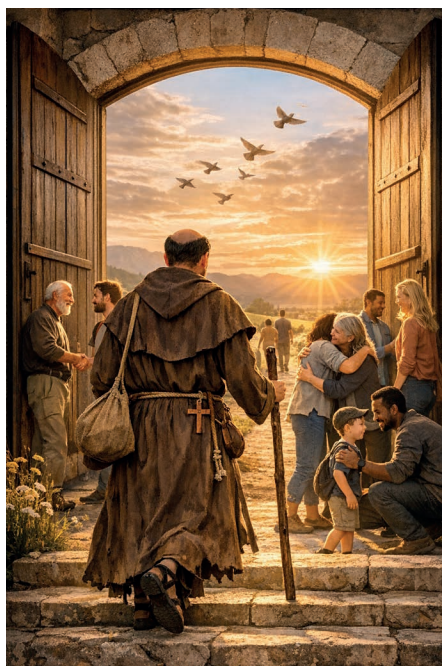
Usciamo incontro alla gente.

Sortire – affidandoci a Lui –, consci delle difficoltà e della fatica davanti a situazioni ignote, sfidanti ed esigenti. La certezza della ricchezza che si nasconde dietro agli ostacoli non appianerà la strada, tuttavia la bellezza del modello francescano si scopre proprio abbandonando i luoghi comodi e protetti, nel desiderio di uscire e riflettere insieme sulle relazioni import-