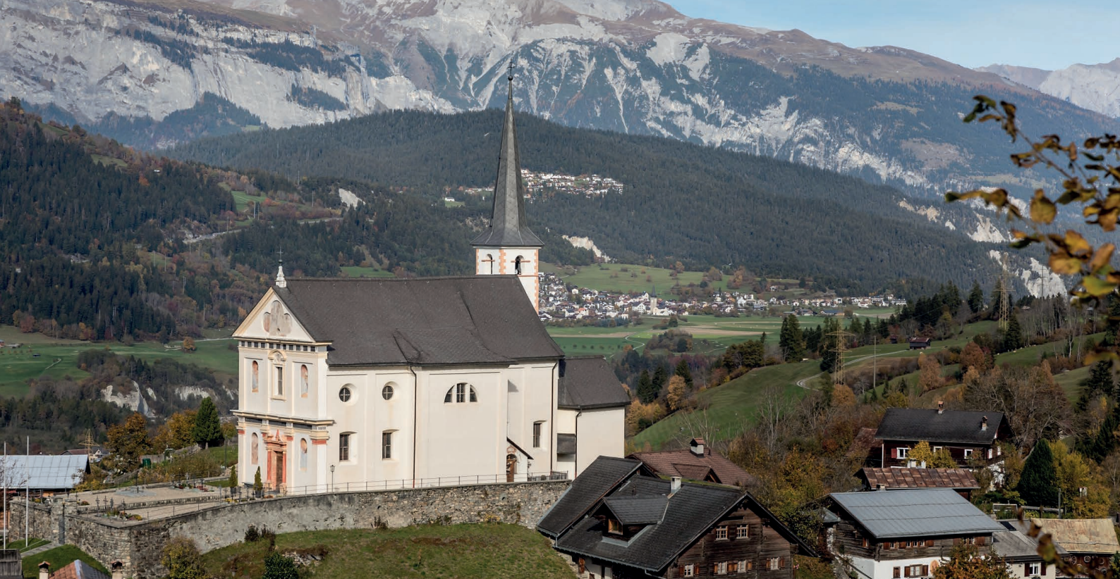
Die Kirche von Sevgein ist dem heiligen Thomas gewidmet.

findet diese Aussage ihr Ziel: Der zweifelnde Jünger erkennt im gekreuzigten und auferstandenen Jesus die Gegenwart Gottes. Thomas formuliert dieses Bekenntnis nicht aus blindem Glaubensgehorsam. Sein inneres Ringen hat ihn zu dieser Aussage – zu seinem Glauben – gebracht.