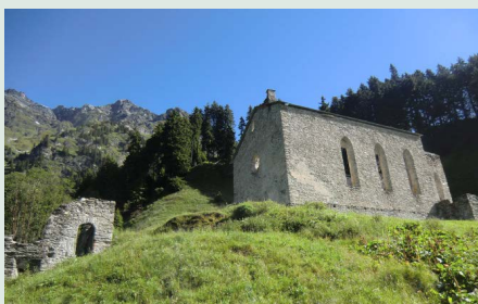
Reste der Gaudenz geweihten Kirche über seinem Grab und des Hospizes bei Casaccia