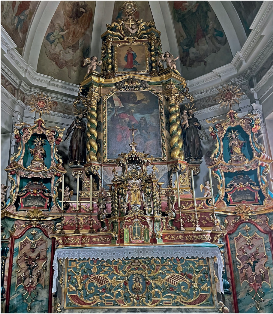
In der Mitte des Altars in Sevgein ist der heilige Thomas dargestellt.

tät des heiligen Nikolaus von Flüe. Dessen berühmtes Gebet beginnt mit genau jenem Satz, den der Apostel Thomas im Johannesevangelium spricht: «Mein Herr und mein Gott ...»