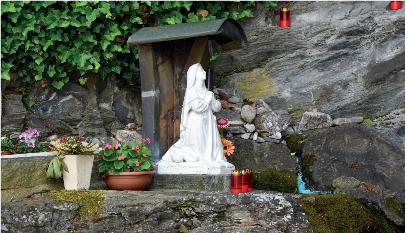
Detail bei der Lourdes-Grotte in Chur.