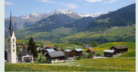
Degen cun baselgia s. Maria

Die Pfarreirat lädt alle zur diesjährigen Wallfahrt nach Degen (Kirche s. Maria) ein. Die Kirche hat eine interessante Geschichte. Verschiedene Maler hinterliessen im Verlauf der Jahrhunderte ihre Spuren. Eine fachkundige Person wird uns die Geschichte und die Bedeutung der Kirche erläutern. Auf dem Weg von Vignogn nach Degen besichtigen wir die Kapelle Sogn Gudegn.