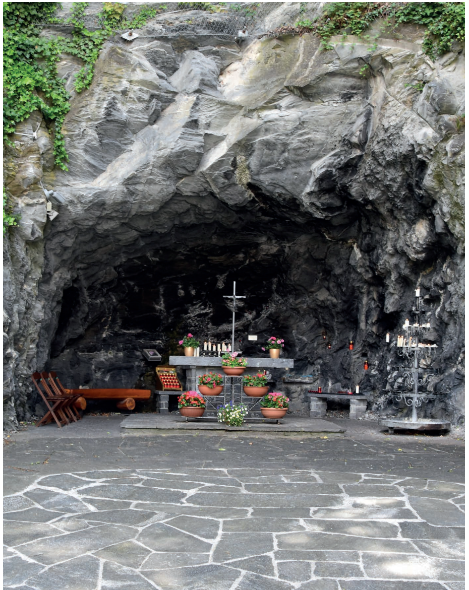
Die Lourdes-Grotte in Chur wurde dem Original nachempfunden.

Rechtlich gesehen gehört die Lourdes-Grotte Chur einer kirchlichen Stiftung, die von Dompfarrer Gion-Luzi Bühler ex officio prä-