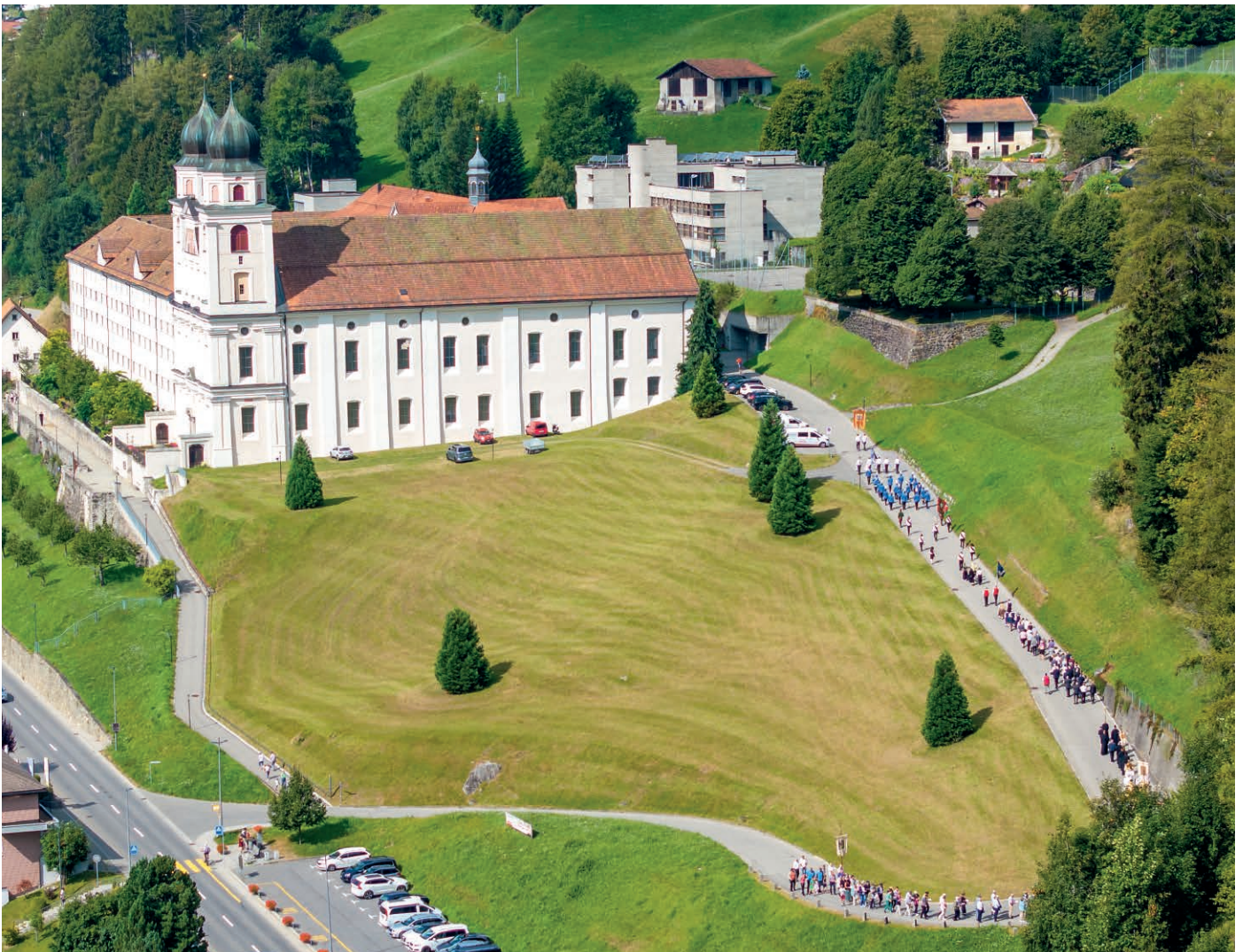
Die Pilger auf dem Weg.

Disentis hat seit 2024 eine neue Attraktion: «La Pendentia – Graubündens längste Hängebrücke». Weniger bekannt ist, dass Disentis noch einen weiteren Anziehungspunkt hat: einen Aquädukt als Ziel einer Pilgerfahrt.