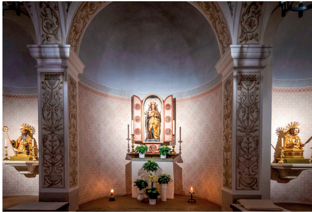
Das Gnadenbild der Mutter der Barmherzigkeit in der Marienkirche.

Inwiefern ist nun Maria die Mutter der Barmherzigkeit? Bereits in der Ostkirche der ersten Jahrhunderte wurde Maria «die Barmherzige» genannt. Erstmals begegnet dem heiligen Benediktiner Odo von Cluny im 10. Jahrhundert die Bezeichnung Marias als Mater Misericordiae. Diese Be-