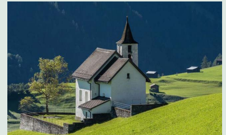
Caplutta s. Gudegn

Die Pfarreirat lädt alle zur diesjährigen Wallfahrt nach Degen (Kirche s. Maria) ein. Die Kirche hat eine interessante Geschichte. Verschiedene Maler hinterliessen im Verlauf der Jahrhunderte ihre Spuren. Eine fachkundige Person wird uns die Geschichte und die Bedeutung der Kirche erläutern. Auf dem Weg von Vignogn nach Degen besichtigen wir die Kapelle Sogn Gudegn.