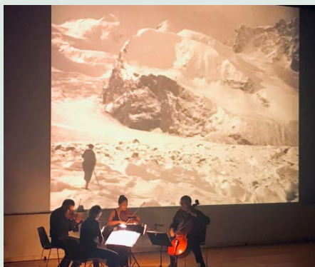
Igl Amar Quartett cun il film met

La dumengia sorprendin nus vus cun in program da trio da violina, trumbetta ed orgla cun ovras da Johann Sebastian Bach, Georg Philipp Telemann, Joseph Gabriel Rheinberger e Felix Mendelssohn.